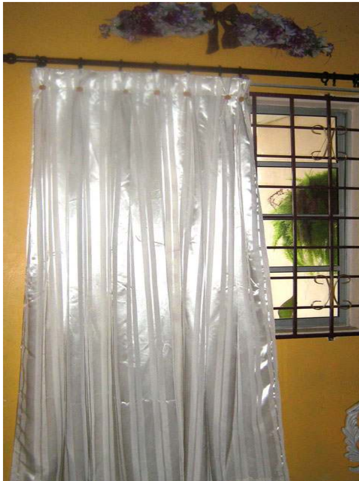
Gambar 1 – Contoh Paten Langsir Berlipat V

Dibawah ini kami sertakan gambar contoh paten berlipat V.